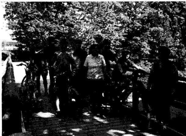
Velotour um den oberen Zürichsee

Der Berg – und Skiklub, ALPINA HERISAU, am 12. Februar 1908 gegründet bietet den Freunden des nicht extremen Sommer und Wintersportes:- ein ihrer Möglichkeiten entsprechendes Jahresprogramm für gesellige und erklärte Erlebnisse,- eine 1922 gebaute und heute im Frondienst unterhaltene Klubhütte für alle Arten von Anlässen und Familienferien.- ein Hineinwachsen in den Berg- und Skisport und die Pflege der Natur und deren Ressourcen